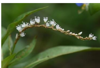
シロバナサクラタデ