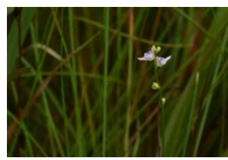
ホザキノミミカキグサ