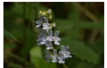
シマジタムラソウ