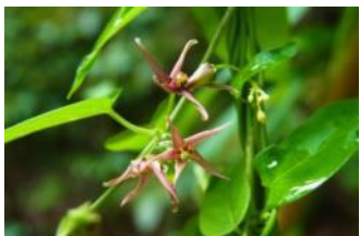
コバノカモメヅル