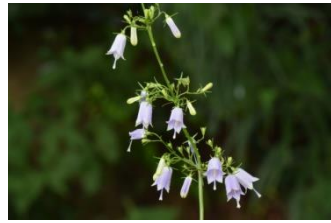
ツリガネニンジン